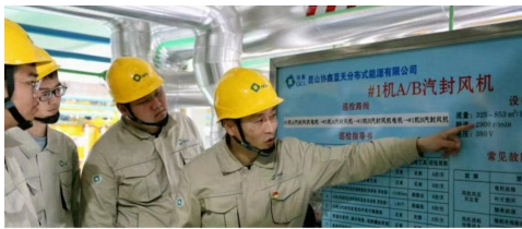
【征文摄影大赛】青蓝工程（组图）